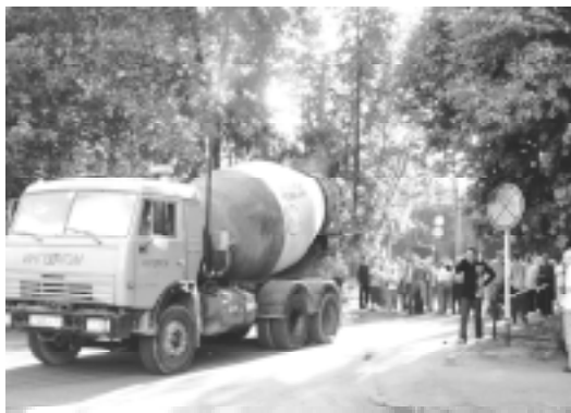
Противостояние жителей строительному беспределу

сосновом бору стометровый жилой комплекс с подземным паркингом на 413 машиномест. По данным независимого эксперта, при рытье котлована строители могли разрыть бетон и землю, которые в течение многих лет получали радиоактивное излучение от «курчатовских» захоронений.