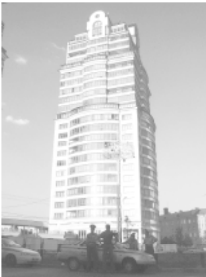
«Шедевр» «точечной» застройки

В крупную общественную кампанию вылилось противостояние жителей улицы Маршала Бирюзова, борющихся со строительным беспределом компании «Донстрой». Застройщик планирует возвести в