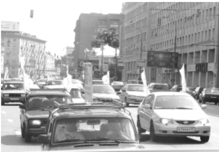
«Яблочная» автоколонна была поддержана автомобилистами Москвы сигналами клаксонов

Весь воскресный день колонна из 15 автомобилей с партийной символикой инспектировала проблемные объекты города — дворы и скверы, где ведется «точечная» застройка и вырубаются зеленые насаждения.